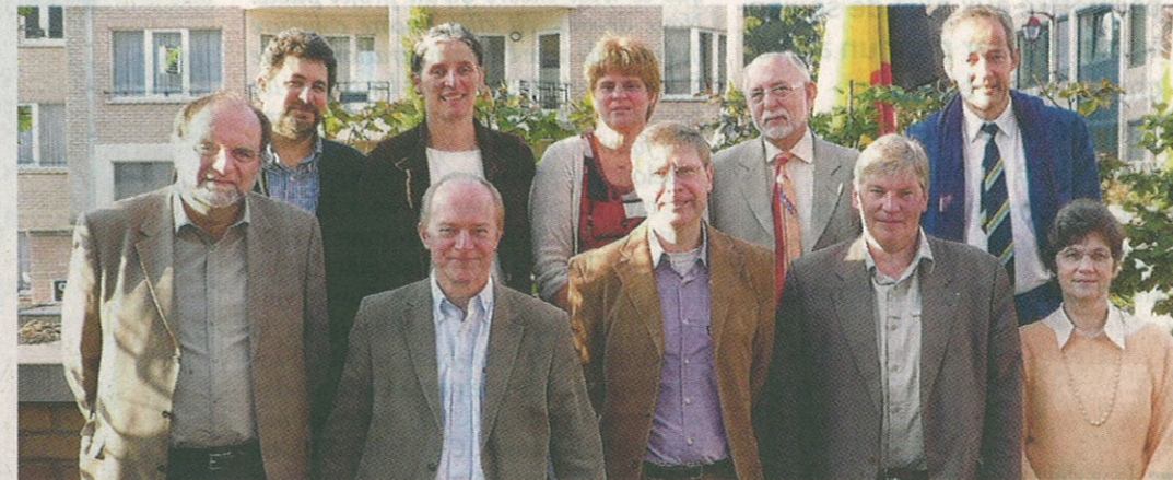
APRÈS LE VOTE quasi unanime de jeudi soir des trois sections locales, avec demande d'embargo de la décision, Écolo, CDH et PS ont, lundi matin, annoncé leur volonté de poursuivre.